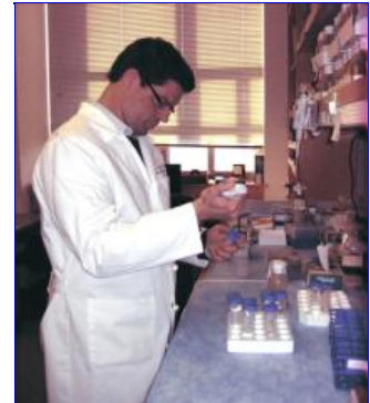
Un puertorriqueño descubre un sistema de comunicación en la reproducción de células